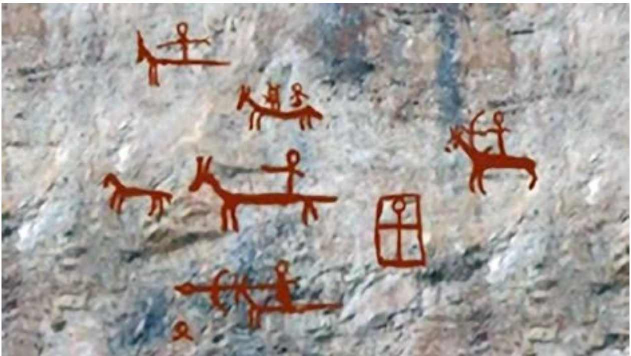
ხომლის ნახატ-ოვანი პიქტოგრამა

ახლა კი მგონი ყველასათვისაც თვალსაჩინო და ამდენად უდაოც უნდა იყოს, რომ აქ თქვენს წინაშე ჩემი მოხსენებით წარმოდგენილი ჭეშმარიტი პრე-ის-სტორია ნამდვილადაც სტორია, რაკი აშკარად ჩემგან დამოუკიდებლად ზუსტად იგივე გაგიმეორათ, უფრო სწორად კი ჩემამდე გაცილებით ადრე უკვე გითხრათ და დაგმოდვრათ წინასწარ წარღვნის მოხდენისთანავე ე. წ. ხომლის სამეფო საგანძურის გამოქვაბულის კედელზე მიხატულმა, ჩვენი ღვთიური წინაპრების მიერ ჩვენთვისვე დატოვებულმა სამემკვიდრეო მოძღვრებამაც; და ერთდროულად ალბათ იმასაც შეამჩნევდით, რომ იგივემ არა მხო-