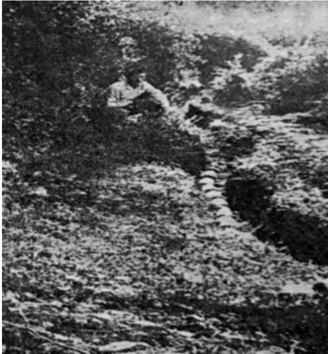
სურ.1. სოფლის ტრასი

აქ საგულისხმოა ისიც, რომ წყალსადენის გაყვანის შემდეგ სოფელს წყალი დაკლებია, რის გამოც სხვა წყალი უძებნიათ დებეტის გასადიდებლად, ამიტამაც არის ეს კონსტრუქცია მინისქვეშა წალშესაკრებელი გვირაბებისა.