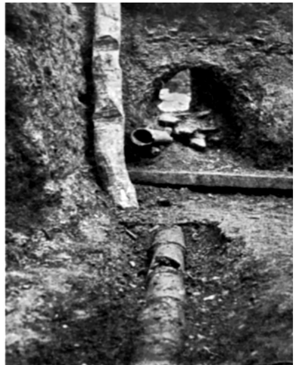
სურ.4 თიხის მილები