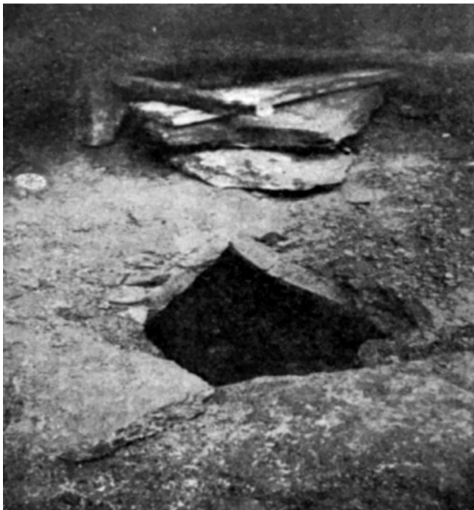
სურ.3 გადახურვის კონსტრუქცია

ისტორიული წყაროები მოგვითხრობს, რომ წყალსადენის წყარო, რომელიც გამოდიოდა „გო-